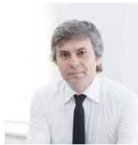
KOORDINATORI SHTETËROR PËR PROGRAMET/ DONATORËT TË CILËT OFROJNË BURSA STUDIMI PËR JASHTË VENDIT

Gjatë periudhës shtator 2017- korrik 2018 ai ka drejtuar sektorin e Programimit dhe Zhvillimit në Agjencinë Kombëtare të Shoqërisë së Informacionit.